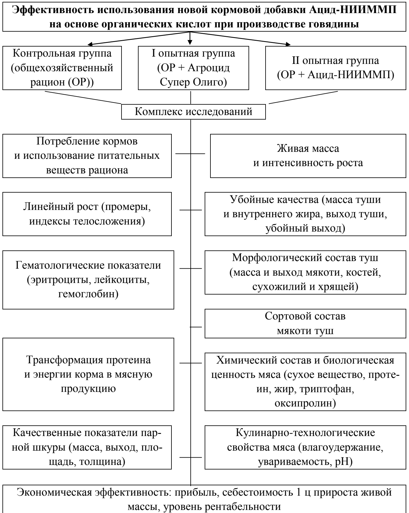
Рисунок 1 – Схема проведения исследований