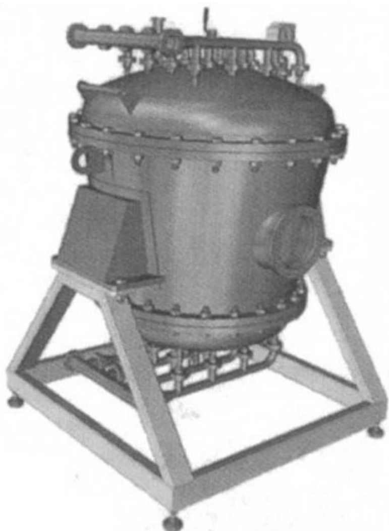
Рисунок 3. Ионообменные колонны ООО «Консит А» Figure 3. Ion exchange columns of LLC "Consit A"

Промышленный модуль для аппаратурного оформления процесса ионообменной обработки молочного лактозосодержащего сырья в статике и динамике по разработке ВНИМИ (связанной, кстати, с Чернобыльской аварией) показан на рисунке 3 [5].